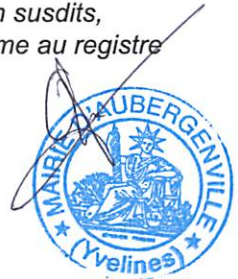
Gilles LÉCOLE, Maire d'Aubergenville