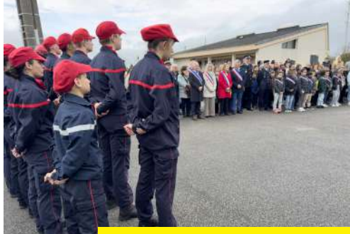
11 NOVEMBRE 2025 COMMÉMORATION