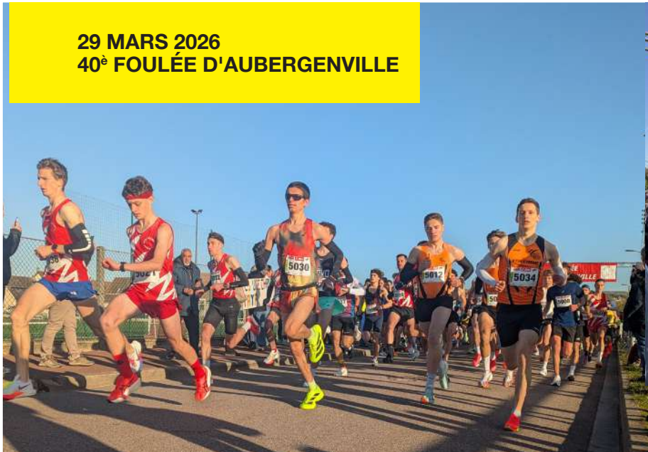
29 MARS 2026 40 e FOULÉE D'AUBERGENVILLE