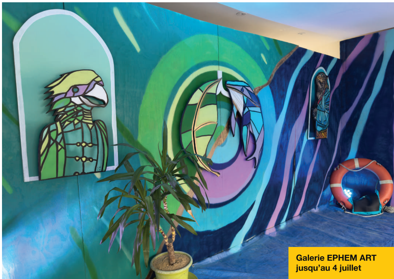
Galerie EPHEM ART jusqu'au 4 juillet