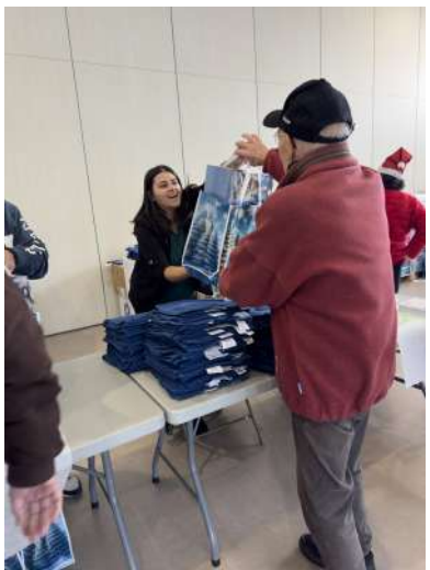
9 DÉCEMBRE 2025 DISTRIBUTION DES COLIS DE NOËL