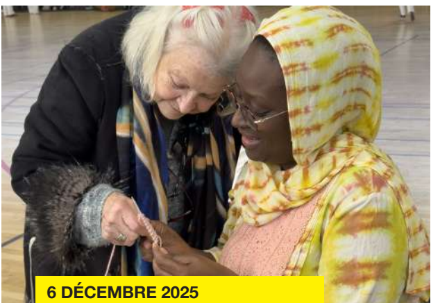
6 DÉCEMBRE 2025 TÉLÉTHON