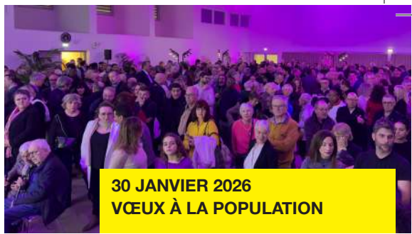
30 JANVIER 2026 VŒUX À LA POPULATION