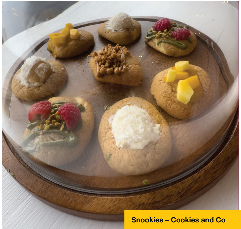
Snookies – Cookies and Co