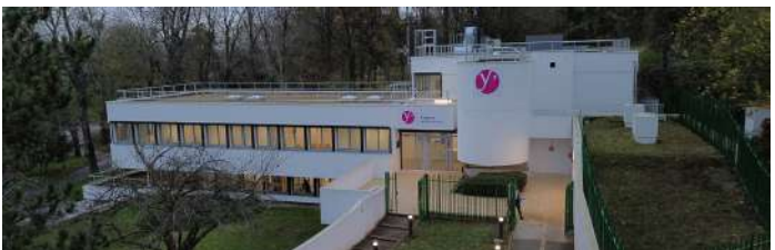
25 NOVEMBRE 2025 INAUGURATION DE LA PMI