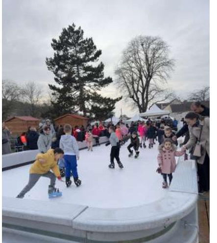
13 DÉCEMBRE 2025 FÊTE DE L'HIVER