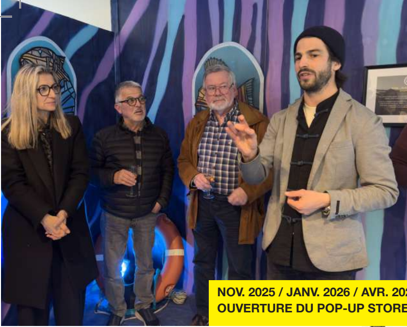
NOV. 2025 / JANV. 2026 / AVR. 2026 OUVERTURE DU POP-UP STORE