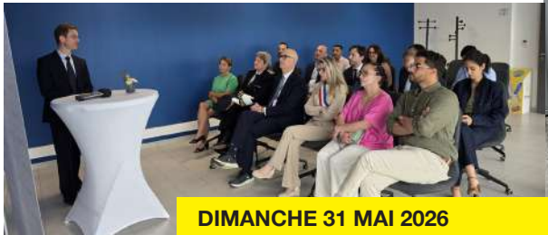
DIMANCHE 31 MAI 2026 VISITE DU MINISTRE ROLAND LESCURE À THÉSÉE DATACENTER D'AUBERGENVILLE.