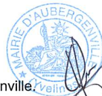
Gilles LÉCOLE, Maire d'Aubergenville.