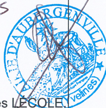
Gilles LÉCOLE Maire d'Aubergenville